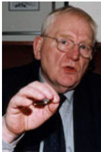
Friedhelm Ost Staatssekretär a.D. (Sprecher)